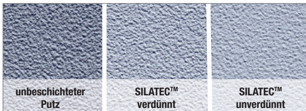
Vergleich unbeschichteter Putz und bei Einsatz von Silatec

Dank dieser Technologie ist Herbol Silatec eine gut füllende Beschichtung mit sehr guter Kuppen- und Kantenabdeckung. Zudem kann die Fassadenfarbe für ein strukturerhaltendes Beschichtungsergebnis auch verdünnt eingesetzt werden. In jedem Fall lässt sie sich leicht verarbeiten.