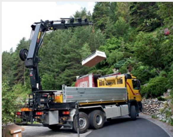
Anlieferung mit dem Autokran