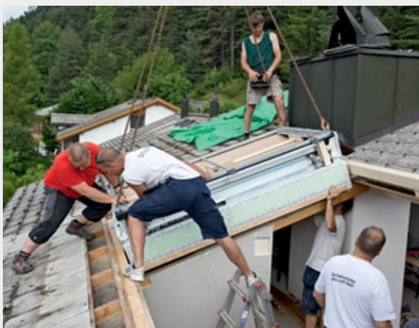
Einbau des Stapelspeichers