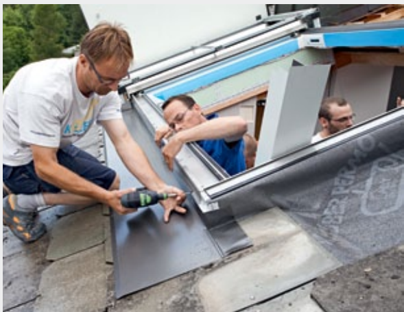
Montage des Eindeckrahmens