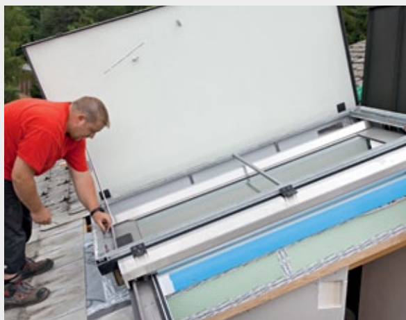
Ausrichten des Azuros