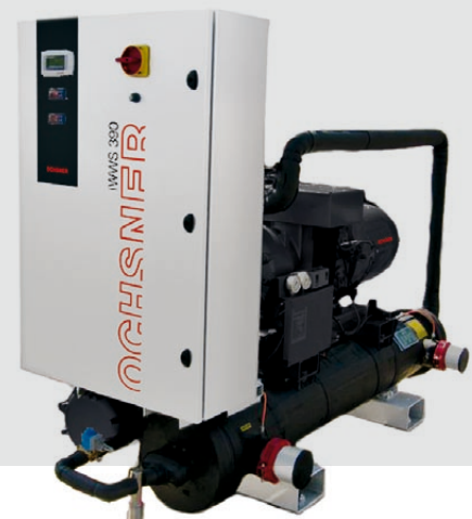
Industriewärmepumpe IWWWS 390 100-1000 kW

Tagungsort: Achat Plaza, Frankfurt / Offenbach Ernst-Griesheimer-Platz 7 63071, Offenbach am Main