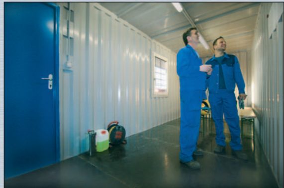
Lagercontainer mit Fenster und Eingangstür